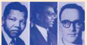
Die Angeklagten Nr. 1, 2 und 3: Mandela, Sisulu und Goldberg